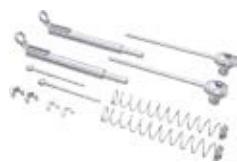
SUS 2 – набор Шестигранный ключ в набор не входит!