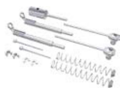
SUS 2 – Стартовый набор Включает CD-диск